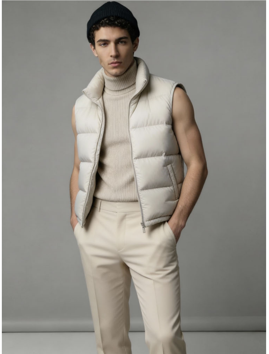
le RICHI / SYNTHETIC TALENT