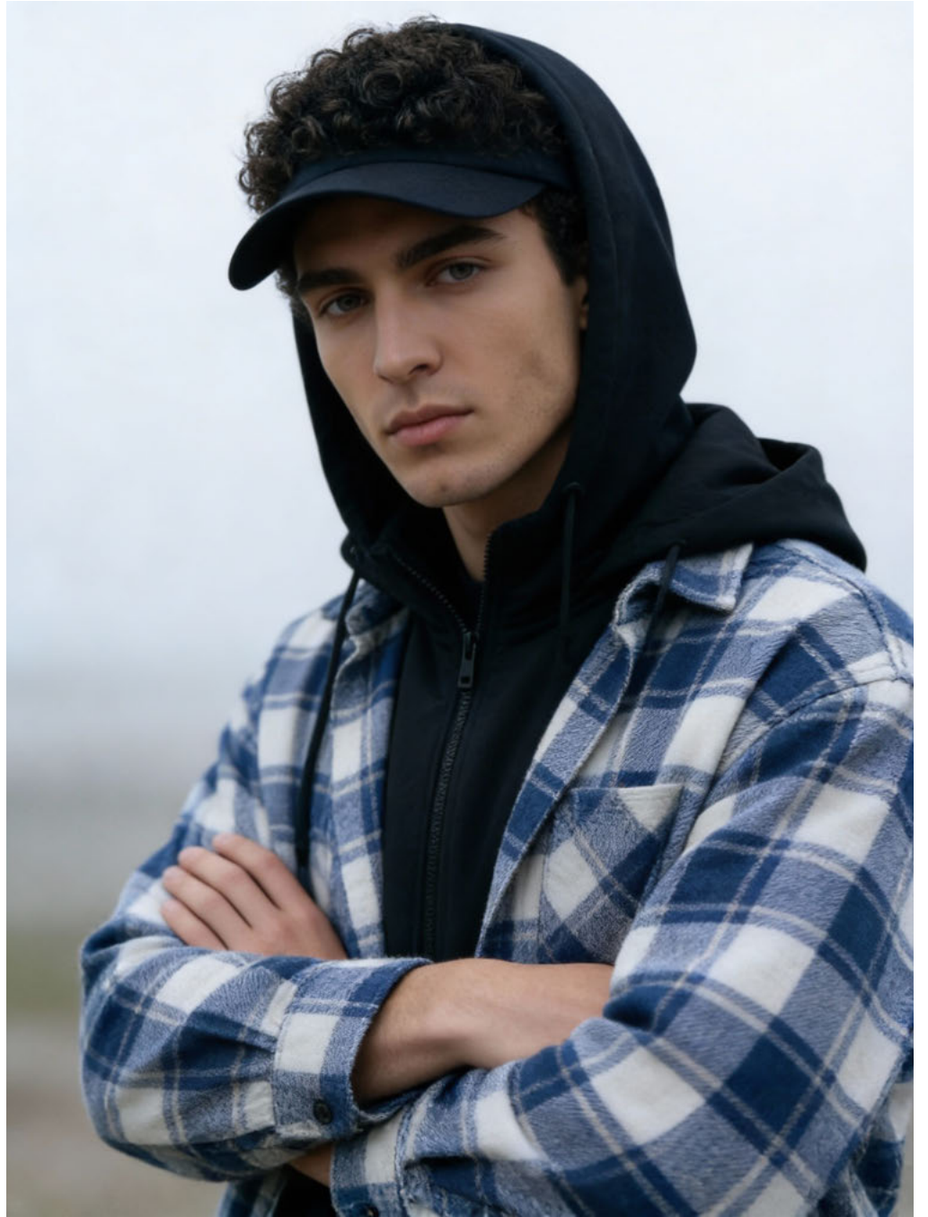
le RICHI / SYNTHETIC TALENT