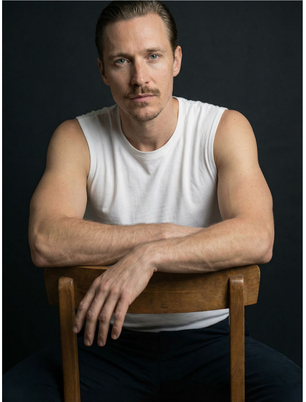
le THEO / SYNTHETIC TALENT