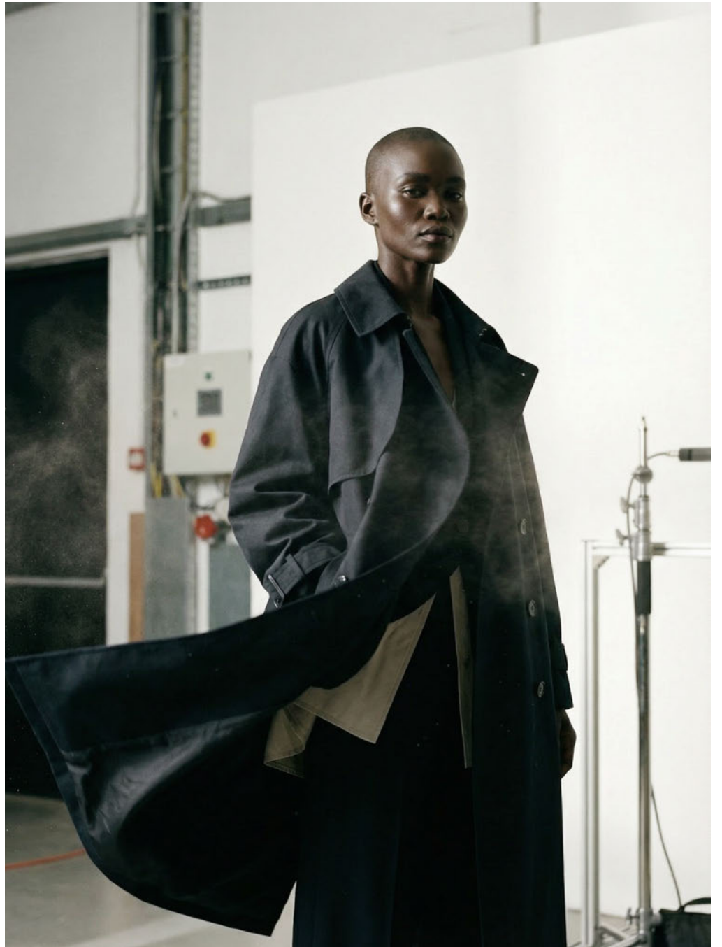
la AMATA / SYNTHETIC TALENT