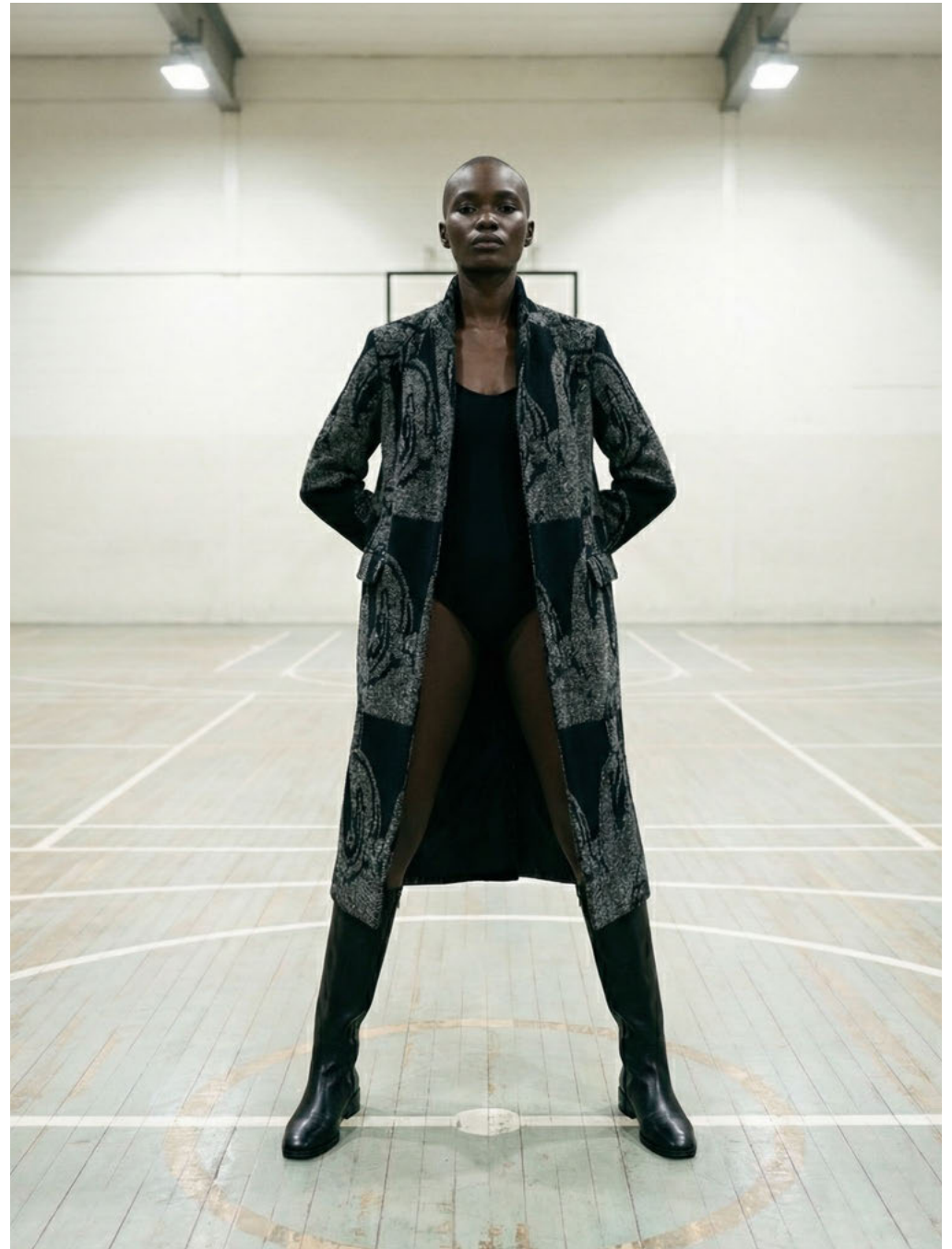
la AMATA / SYNTHETIC TALENT