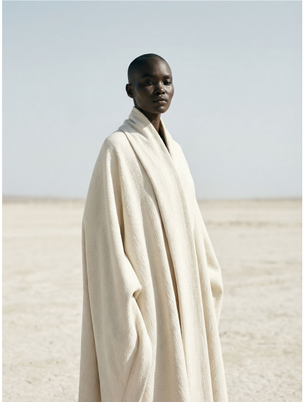
la AMATA / SYNTHETIC TALENT