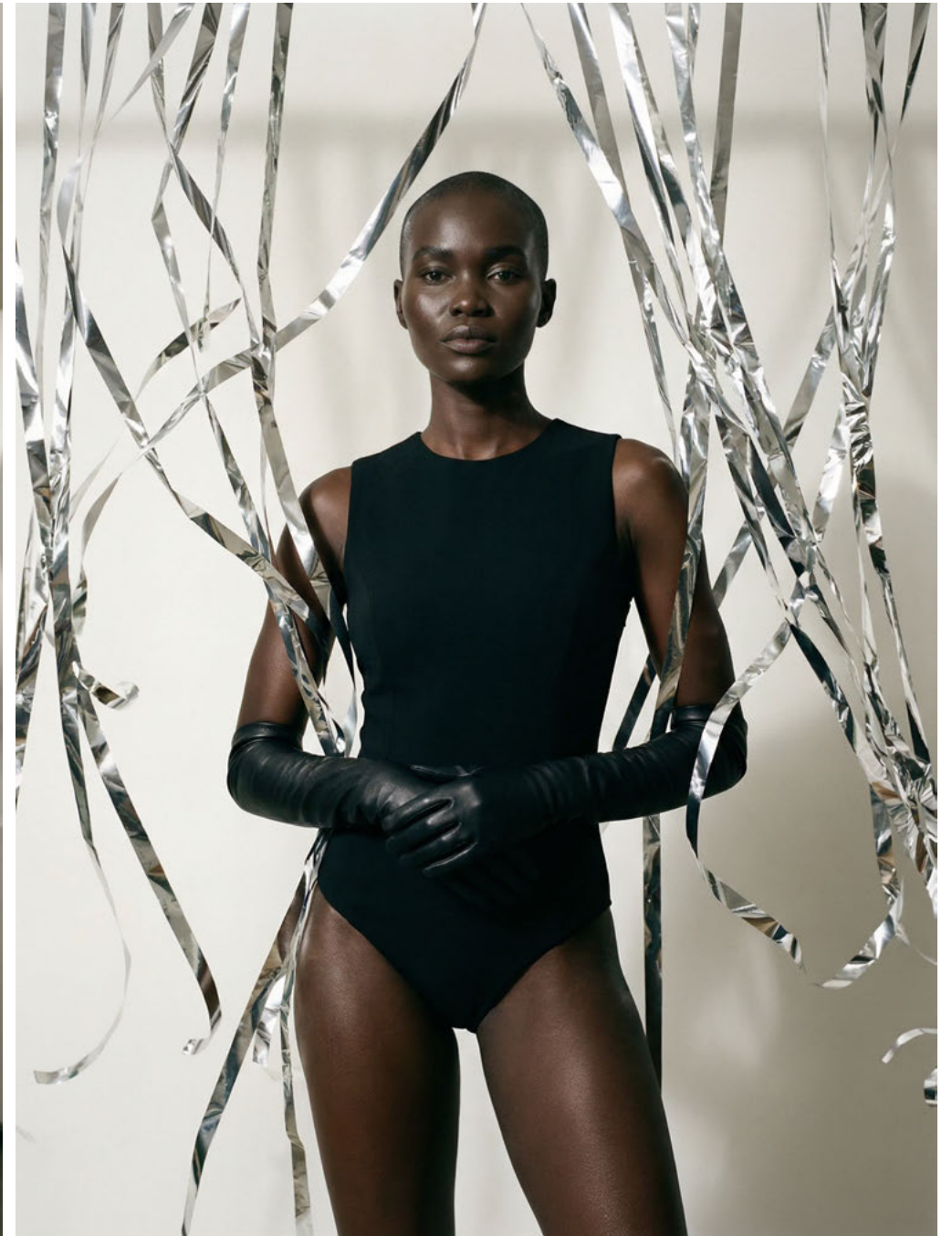
la AMATA / SYNTHETIC TALENT