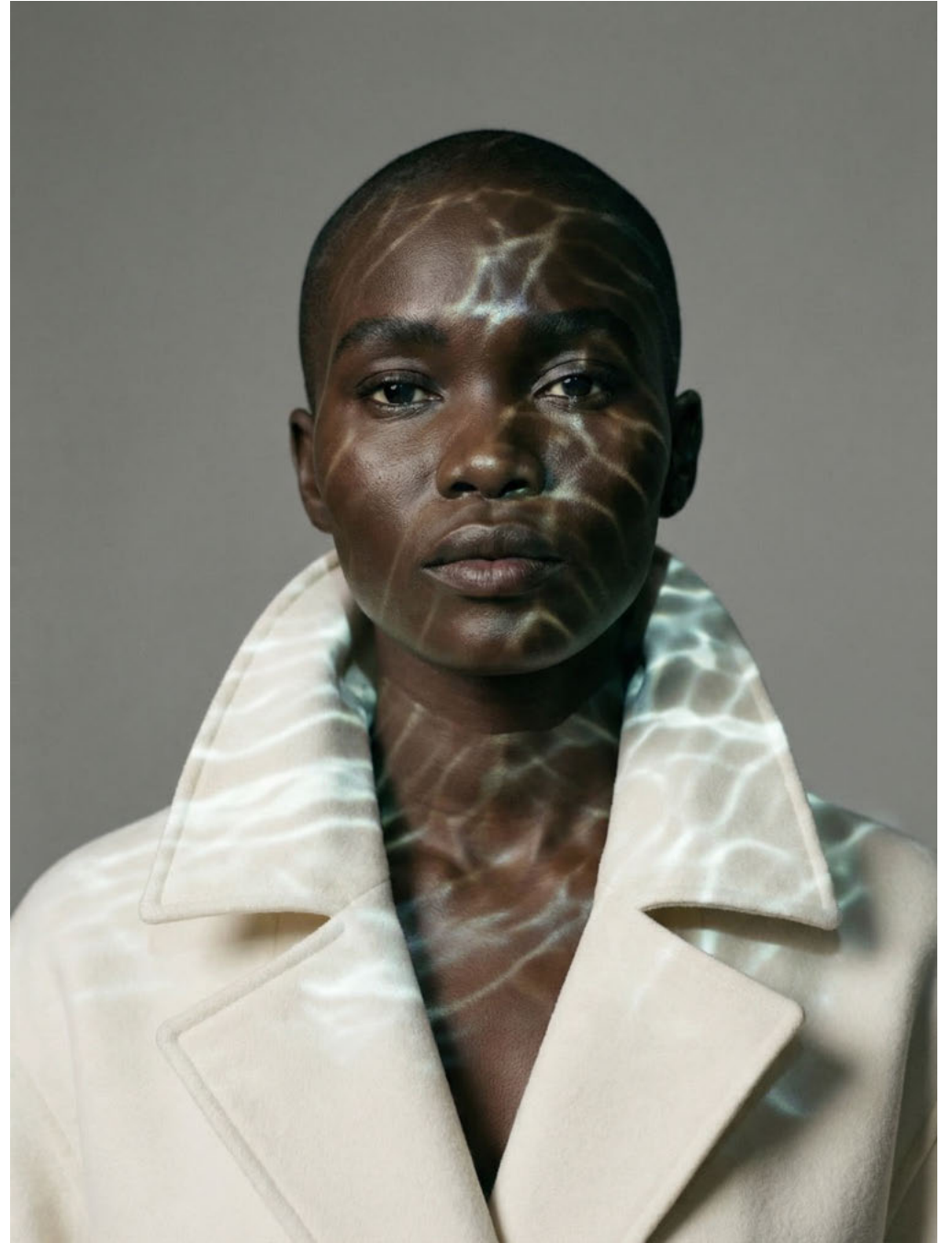
la AMATA / SYNTHETIC TALENT