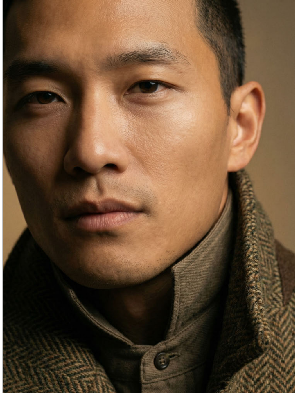
le JIN / SYNTHETIC TALENT