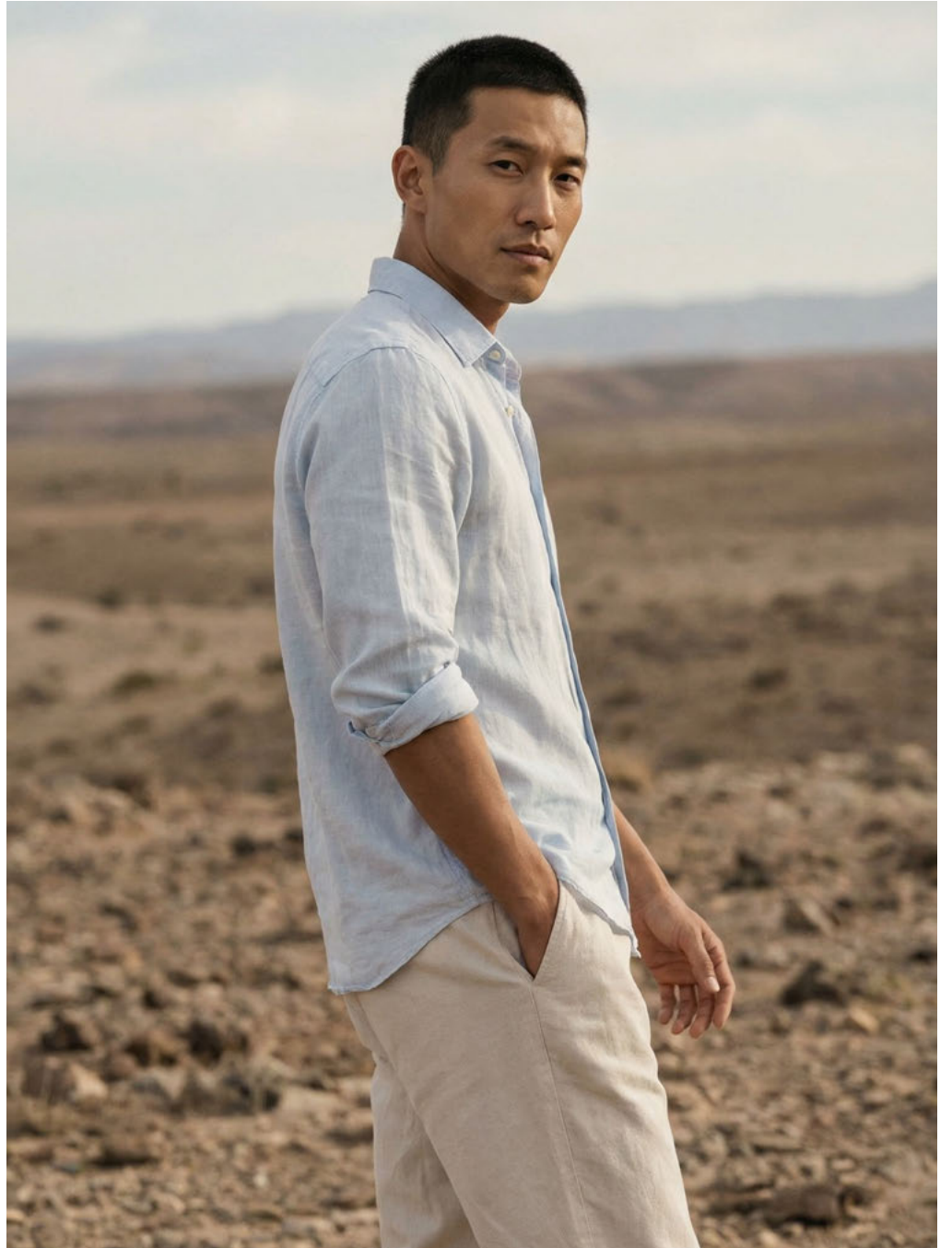
le JIN / SYNTHETIC TALENT